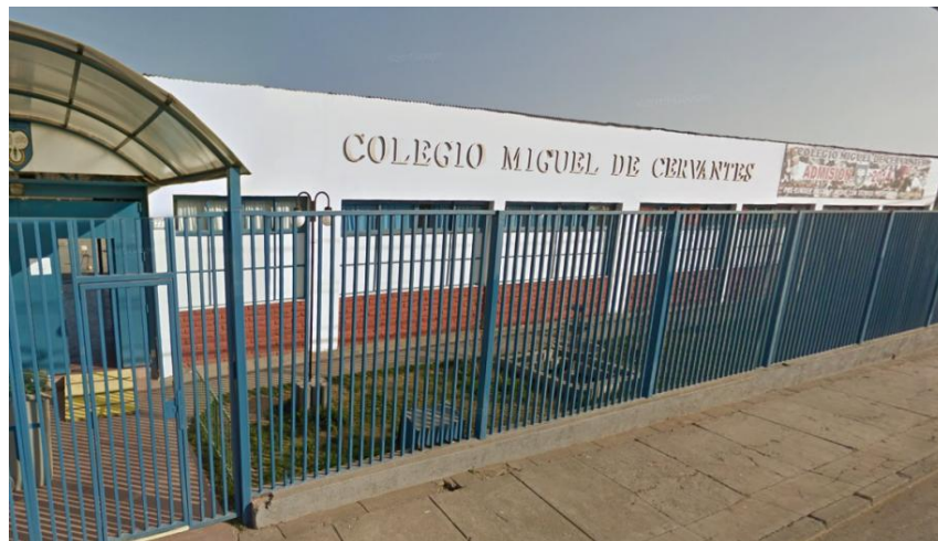
Frontis de nuestro Colegio

El presente Proyecto Educativo Institucional expresa la voluntad formativa del establecimiento Miguel de Cervantes de la comuna de El Bosque con la comunidad educativa y, del mismo modo, muestra un estado de situación particular en este momento, a partir del cual se espera alcanzar ciertos objetivos y propósitos educativos relevantes para todos. En este documento PEI el Colegio Miguel de Cervantes busca realizar importantes definiciones de nivel estratégico, que involucran fundamentos y horizontes de acción relevantes para el devenir institucional de los próximos años.